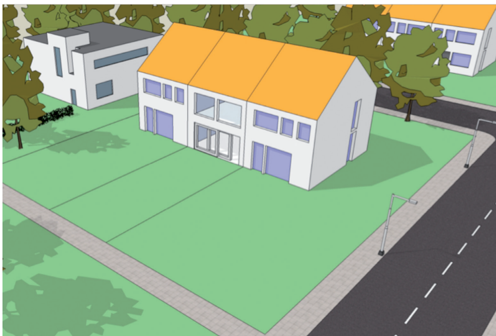
Aan de achterzijde mag de gevelindeling zonder omgevingsvergunning worden gewijzigd

Alleen als voldaan wordt aan alle genoemde voorwaarden mag u de activiteit zonder omgevingsvergunning uitvoeren.